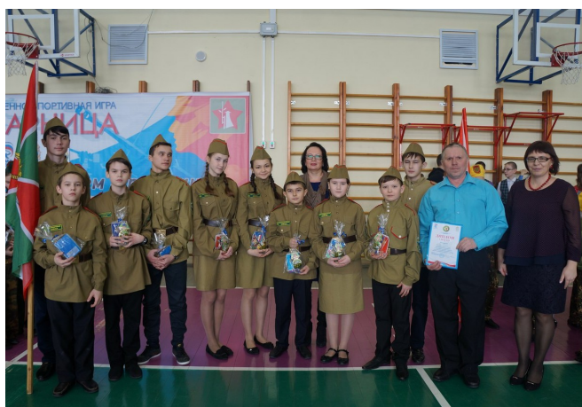
Команда Камышлинской школы занявшая I место (5-9 классы)

шлось в этот день нелегко: команды настолько хорошо выступали, что определить лучших было очень трудно. Все команды-участницы получили грамоты и сладкие призы, а победители еще и памятные подарки. Несомненно, в ходе подобных игр учащиеся приобретают практические навыки начальной военной подготовки и медицины, спортивные умения и навыки. И, конечно же, игровые моменты создают интерес, вызывают стремления ежегодно проводить такие мероприятия и позволяют лучше усвоить и закрепить имеющийся теоретический материал на практике. Такие соревнования формируют и развивают морально-психологические качества учащихся.