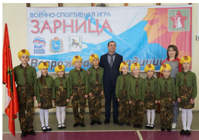
Команда Камышлинской школы занявшая II место (1-4 классы)